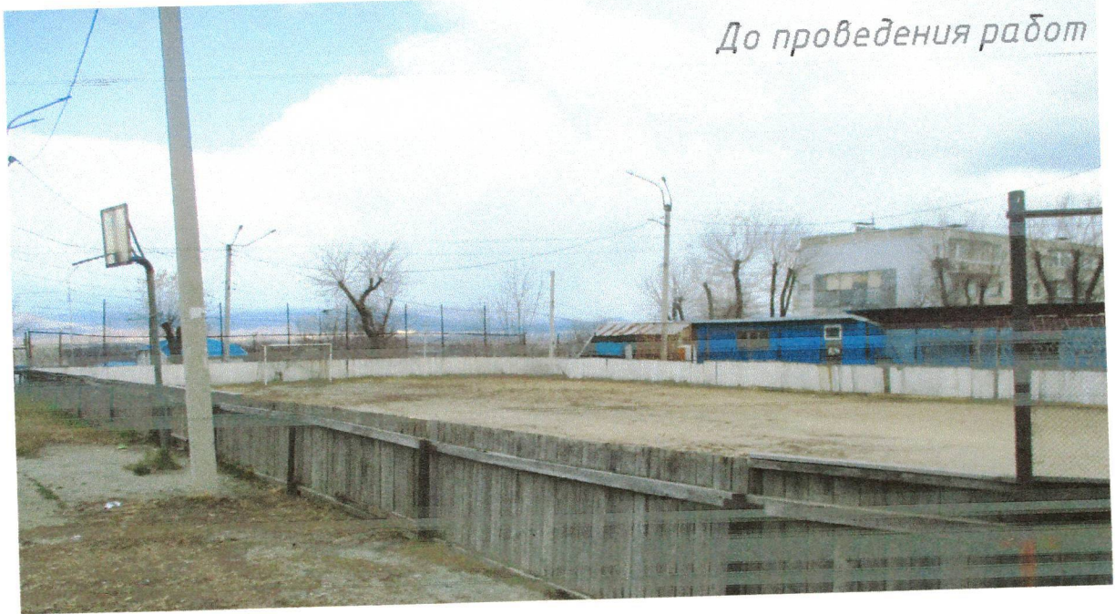
До проведения работ