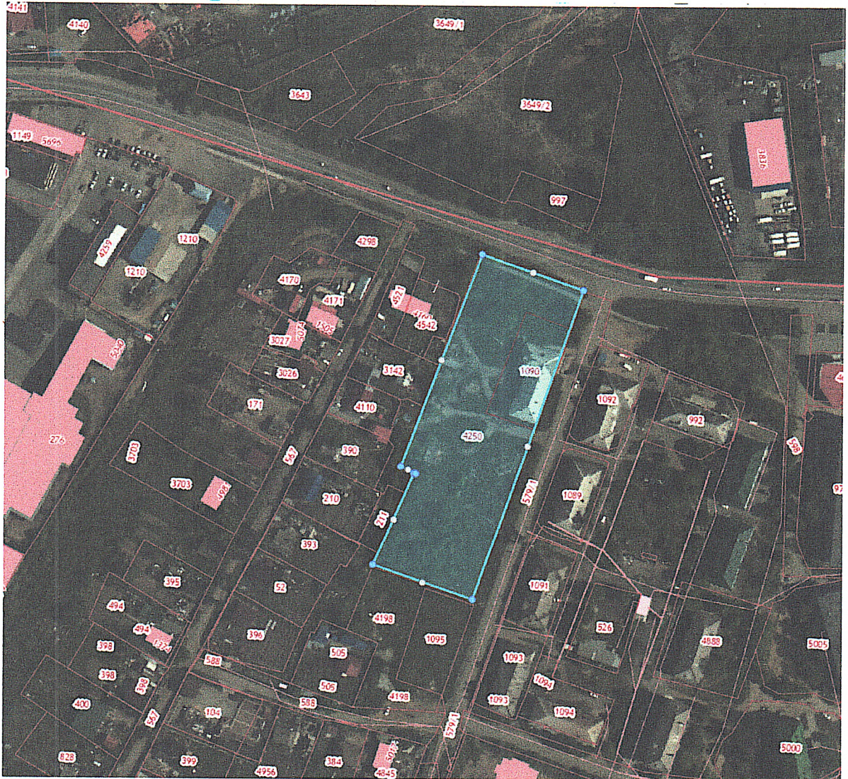
СХЕМА территории, в отношении которой разрабатывается документация по планировке территории

Местоположение: Приморский край, Артемовский городской округ, г. Артем, ул. Берзарина, 2, 6