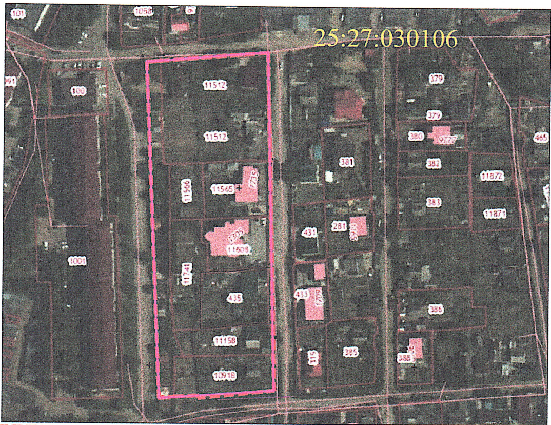
СХЕМА территории, в отношении которой разрабатывается документация по планировке территории

к постановлению главы Артемовского городского округа от 25.12.2024 № 193-112