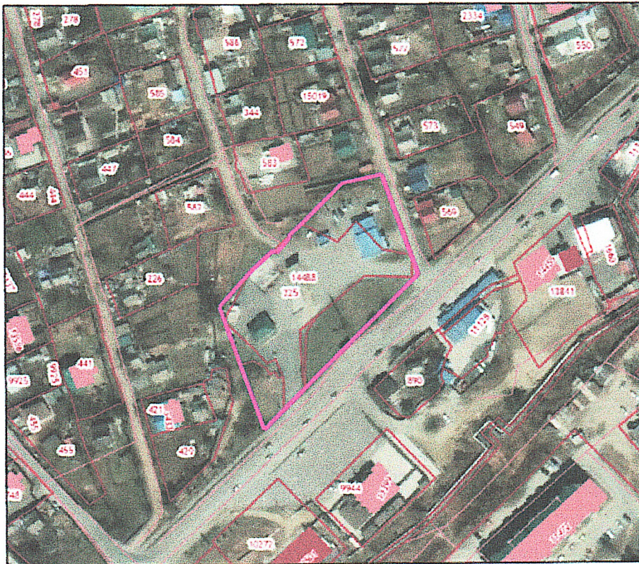
СХЕМА территории, в отношении которой разрабатывается документация по планировке территории

к постановлению главы Артемовского городского округа от 23.12.2024 № 192-112