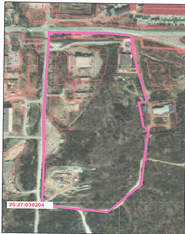
СХЕМА территории, в отношении которой разрабатывается документация по планировке территории

к постановлению главы Артемовского городского округа от 15.12.2024 № 191-112