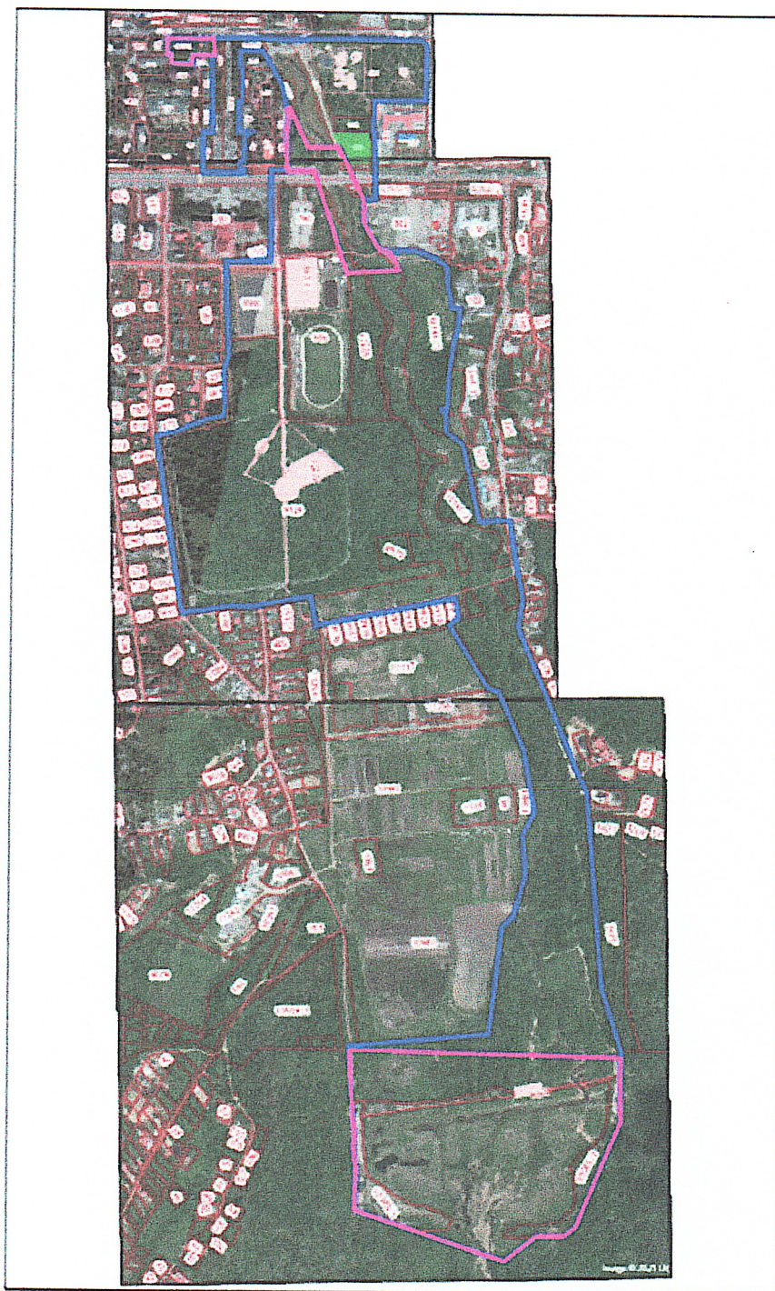
СХЕМА территории, в отношении которой разрабатывается документация по планировке территории

Местоположение: Приморский край, в районе русла реки Озерные Ключи, от земельного участка с кадастровым номером 25:27:020102:387 до пересечения с ул. Кирова в Артемовском городском округе