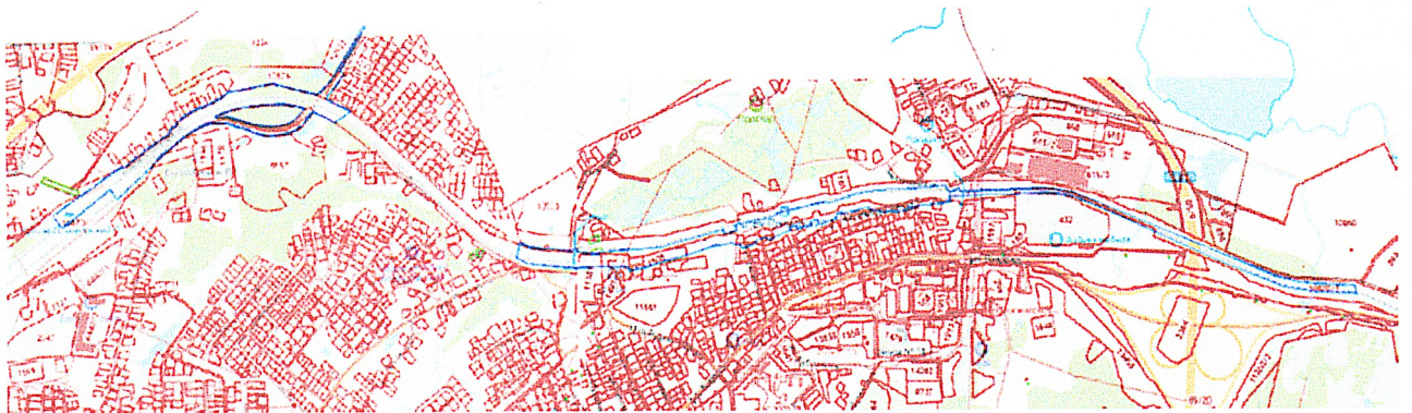
СХЕМА территории, в отношении которой разрабатывается документация по планировке территории