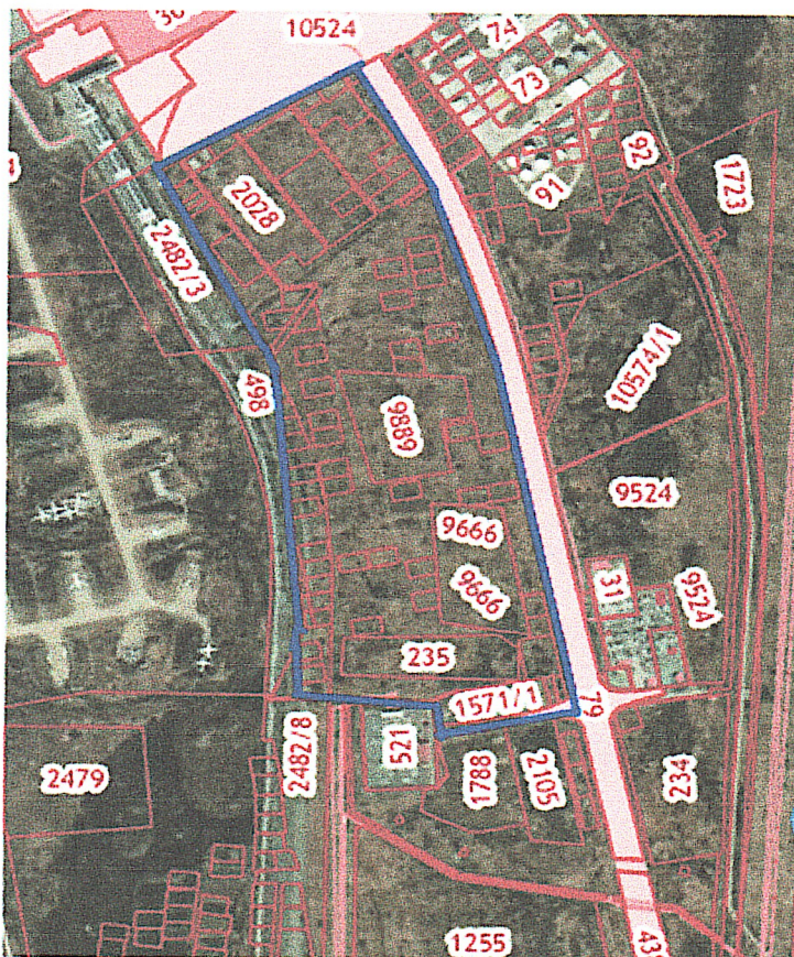
СХЕМА территории, в отношении которой разрабатывается документация по планировке территории

Местоположение: Приморский край, г. Артем, в районе ул. Владимира Сайбея, 50